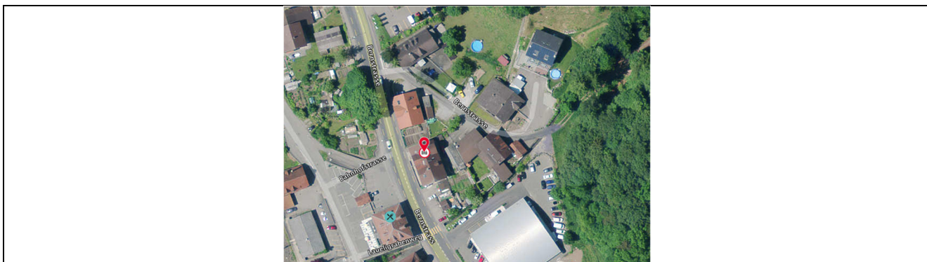
Heimberg Bernstrasse 296, 298, 304 Luftbild 2016