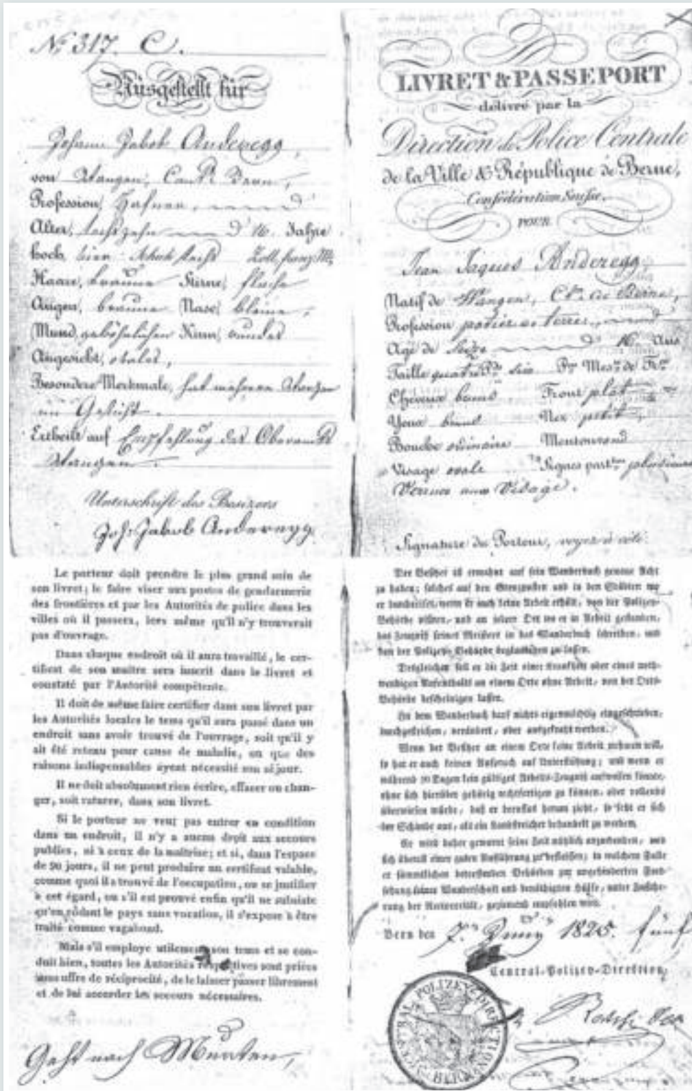
3 Bernisches Wanderbuch von Johann Jakob Anderegg älter, ausgestellt für seine Gesellenwanderung 1825–1829.