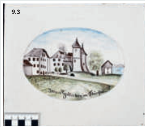
9 Schloss Gottlieben Thurgau, von der druckgrafischen Vorlage (9.1, um 1850), zur Skizze von Johann Jakob Anderegg jünger (9.2, um 1855) und zur fertig bemalten Ofenkachel (9.3, um 1855–1857)

9.1 gemeinfrei, Internet, 9.2 Reproduktion Hans Mühletaler, Städtlmuseum Wangen an der Aare, 9.3 Foto Andreas Heege, Jegenstorf.