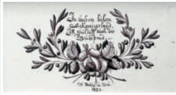
4 Wangen an der Aare, In der Gass 9, Signatürkachel 1829 von Johann Heinrich Egli, Ofenmaler