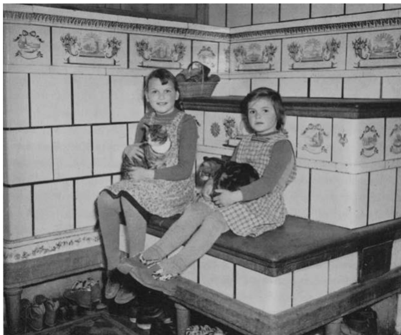
Oben Ofenkachel mit Ansicht des Schlosses Bipp im Bauemhause Willome, Stalden, Bannwil (datiert 1816). Sie stammt aus der Werkstatt J. J. Andereggs, Hafner in Wangen a. d. A., wie vermutlich auch der Ofen, der die gemütliche Ecke unten bildet (datiert 1850; Haus Rösch, Staldenrain, Bannwil)