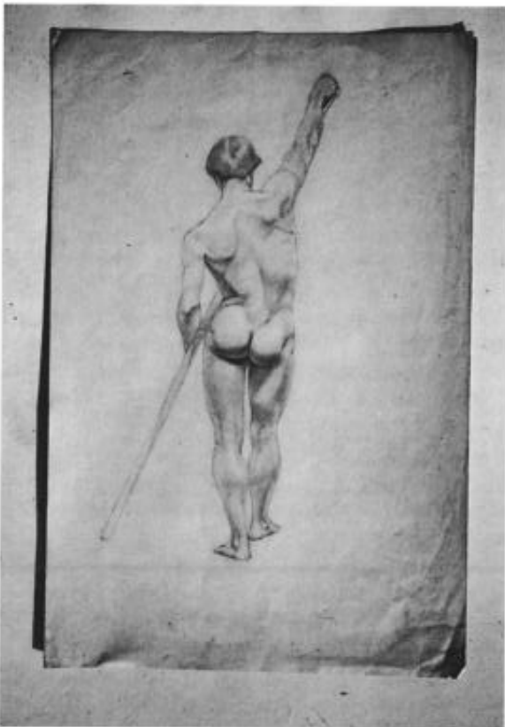
6 Bleistiftzeichnung, männlicher Rückenakt mit Stab. Josef Anton Keiser, 1881 bis 1884. 49,5 x 33 cm.