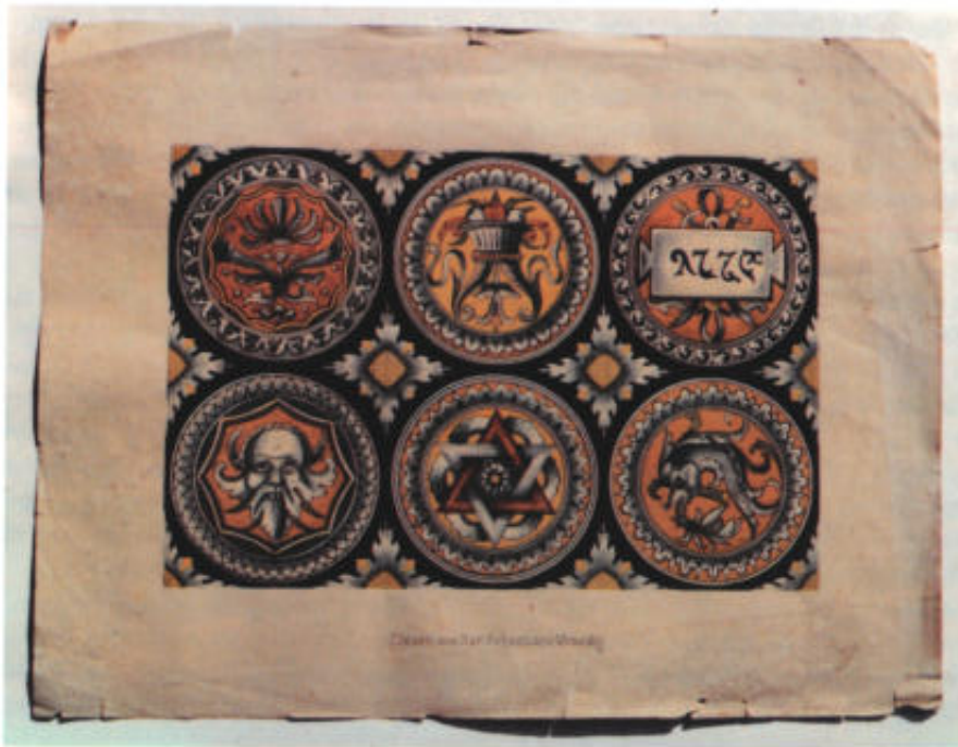
3 Ausschnitt aus einem keramischen Bodenbelag, Bleistift, teilweise mit Zirkel konstruiert, aquarelliert. Beschriftet: »Fliesen aus San Sebastiano Venedig«, Rückseite beschriftet: Keiser. 50 x 65,5.