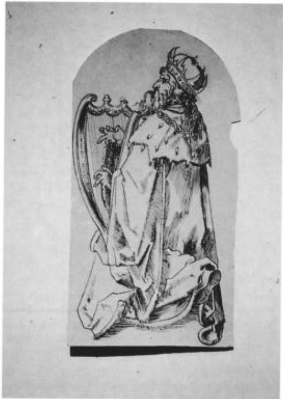
8 Zeichnung, in Bleistift vorgezeichnet, mit Tusche ausgezogen, ausgeschnitten in Arkadenform. Dargestellt ist in Dreiviertel-Rückenansicht ein Harfe spielender König David, schwer lastet der pelzgefütterte Mantel mit großem Pelzkragen auf seinen Schultern. Detail aus Albrecht Dürers Randzeichnungen zum Gebetbuch des Kaisers Maximilian I., entstanden 1515. Josef Anton Keiser. Um 1884. 25,2 x 13,2 cm.