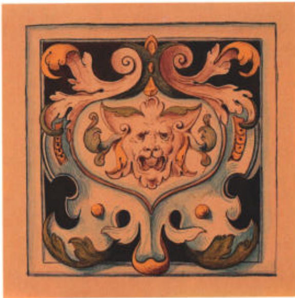
9 Zeichnung zu einer Kachel, Gouache, Bleistift vorgezeichnet. Dargestellt ist eine Blattmaske, darum herum Rahmenwerk mit Akanthusblättern. Diese Zeichnung wurde als Kachel ausgeführt. Vgl. Abb.10. Signiert Jos. Keiser, zwischen 1881 und 1884. Blatt 56 x 43 cm. Zeichnung 24 x 23,7 cm.