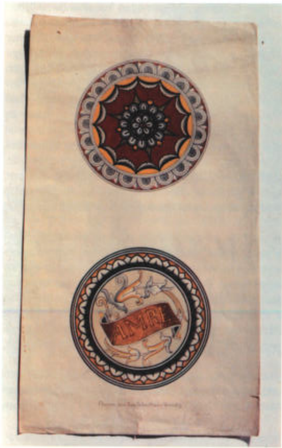
2 Bleistiftzeichnung, teilweise mit Zirkel konstruiert, aquarelliert. Beschriftet: »Fliesen aus San Sebastiano Venedig«, signiert Joseph Keiser. Um 1881. 69,3 x 39 cm. (Foto der Autorin)