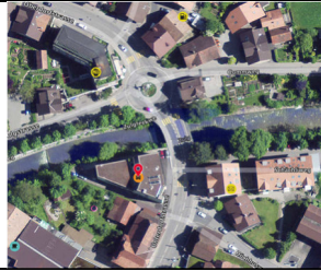
Steffisburg, Unterdorfstrasse 2